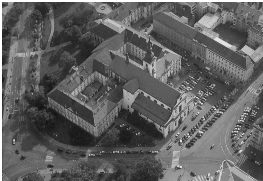
Kostel sv. Tomáše v současnosti